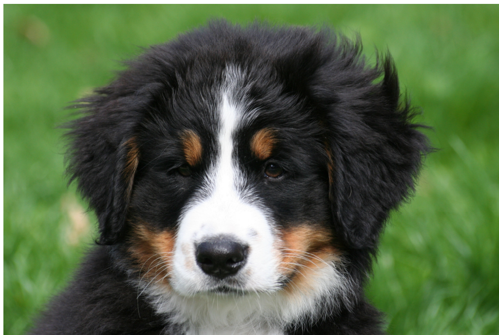
Laika, d'Hélène Gruber (8 mois)