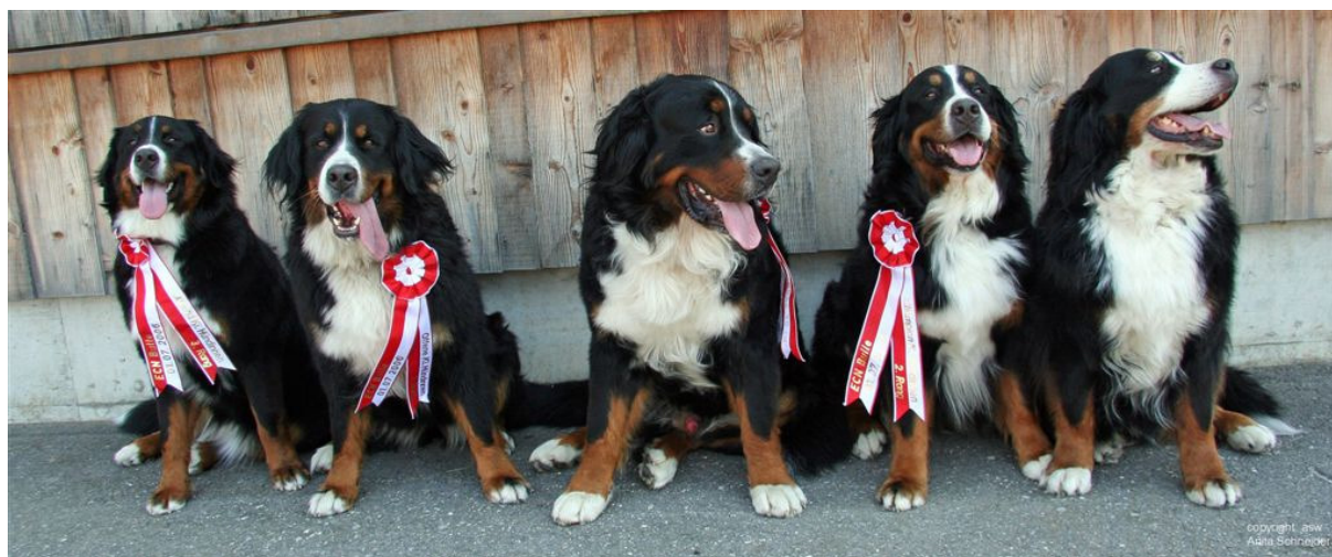
"PORTRAIT DE GROUPE AVEC MÂLE" (librement inspiré d'Aleksandar Petrovic...)