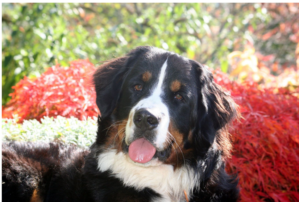
Laïka a grandi!