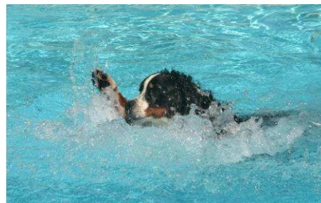
Il y a les grands nageurs...