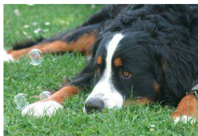
et ceux qui restent zen.