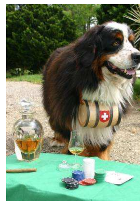
Ceux qui partent sur un autre continent, explorer le Mexique se reposer sur une plage ou jouer à Las Vegas...