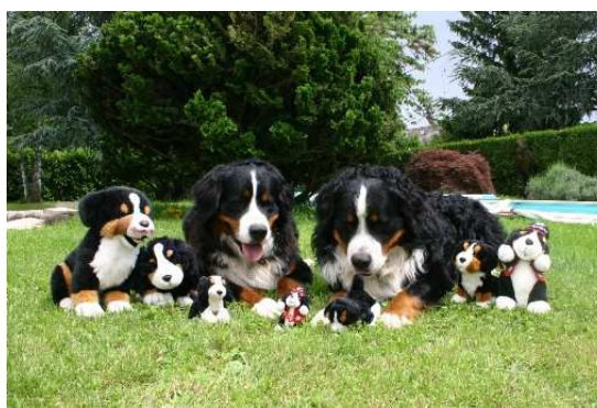
Ceux qui font la fête ou ceux qui préfèrent partir en famille...