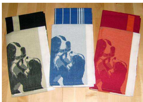
Ensemble de linges de cuisine